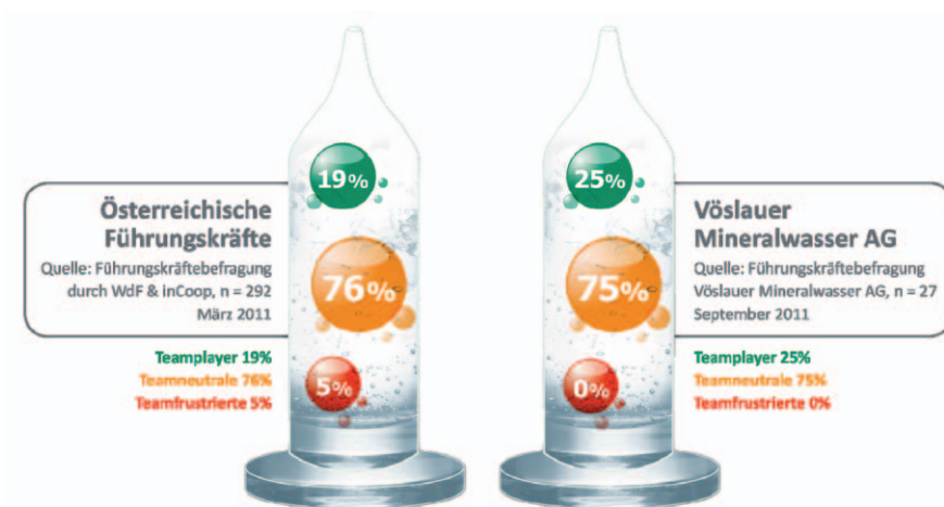
Abbildung 3: Ergebnisse des „Teamgeist-Barometers“ im Vergleich

Veranstaltungstipps, unter anderem zum Thema Konfliktmanagement, finden Interessenten unter www.personal-manager.at/seminare .